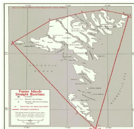
【圖 2】 丹麥法羅群島的領海基線