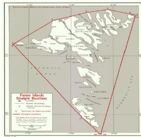
【圖 2】 丹麥法羅群島的領海基線

資料來源：Bureau of International Intelligence and Research, "Straight Baselines: Faeroes," Limits in the Seas , No.13, March 12, 1970, https://www.state.gov/documents/organization/62005.pdf .